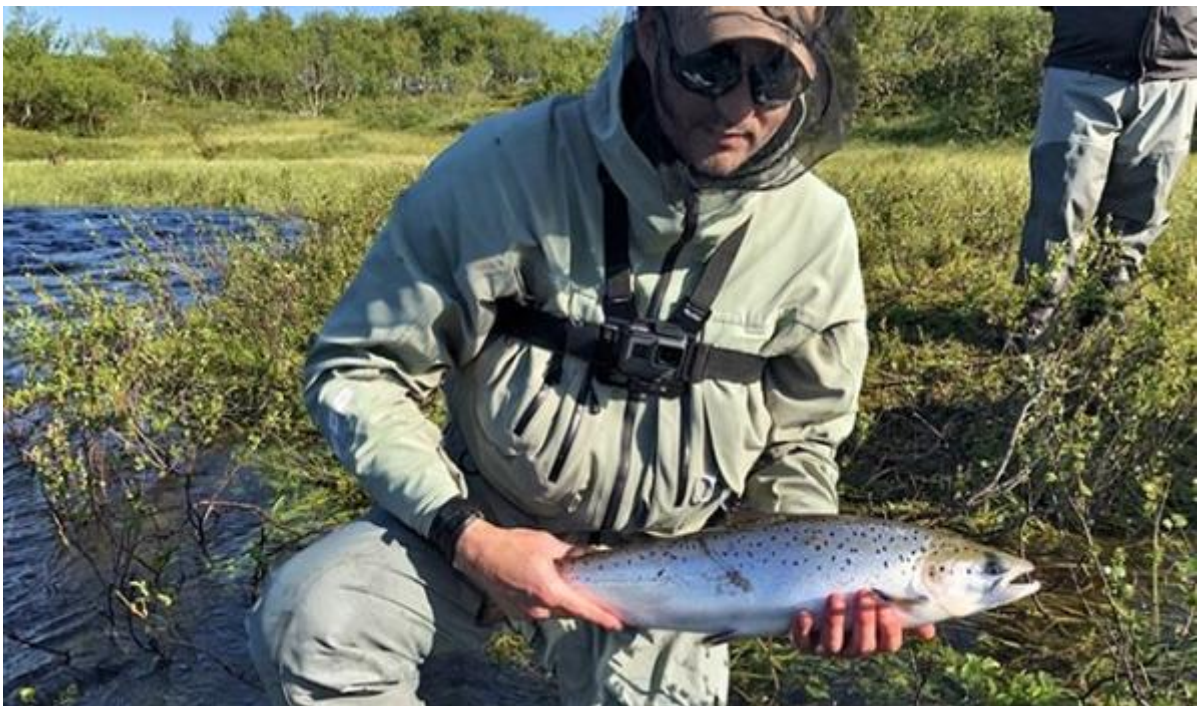
En nystigen pärla från "big plate"

Vi fångar fisk i princip varje dag, jag och min bror får endast grills under veckan men övriga fiskare får ett antal större fisk, totalt landar gruppen 33 grills och 11 lax (över 70cm, med en topp på 92cm). Vi får även ett antal puckellax, brunöring och gädda men de räknas inte med i statistiken.