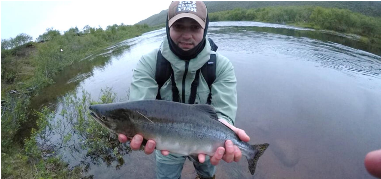
Puckellax (pink salmon) som även här är en invasiv art.