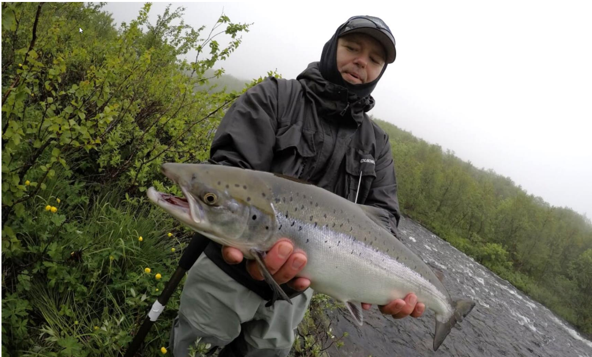
Brorsan men en liten silvertorped

En vecka går på tok för snabbt och avfärden känns vemodig, men samtidigt förgyller denna typ av äventyr fiskesemestern och man längtar snabbt tillbaka igen, så Kola, vi ses igen och hej då Drozdovka airport för denna gång!